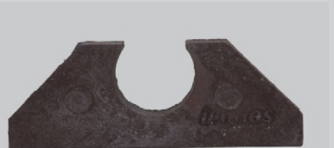
Vor dem Einsatz: Schlauchdrallstopper