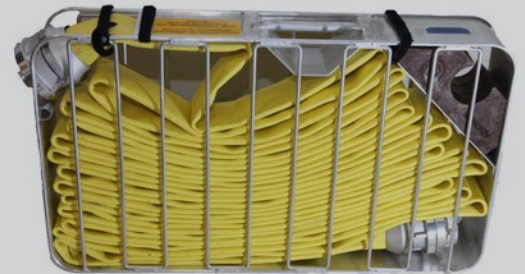
Für den Transport: Düsenschlauch im DIN-Schlauchtragekorb