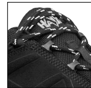
Schnürellemente mit Reflex