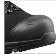
HAIX® Composite Schutzkappe